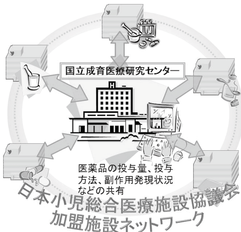
図1：日本小児総合医療施設協議会加盟施設ネットワーク概念図

情報処理環境（小児医療情報収集システム）を整備しています。このシステムでは、日本小児総合医療施設協議会加盟施設等からなるネットワークを活用しています（図1）。